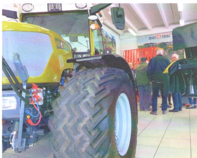
Empfang mit Kaffee und Gipfeli.

lich rund 30 Traktoren in verschiedenen Ausführungen produziert. Die grössten Probleme schaffen weder die Produktion noch der Verkauf. Sorge bereitet vielmehr die stetig steigende Regulierungswut von Verwaltung und Politik. Aber mit Blick auf bevorstehende Wahlen versprechen uns