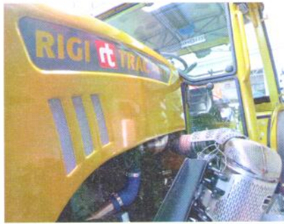
Die Abgasreinigung benötigt viel Raum.