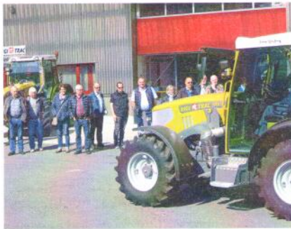
Und jetzt die Vorführung.