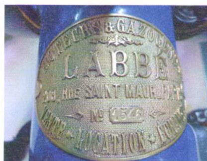
Schon das Typenschild eine Augenweide.