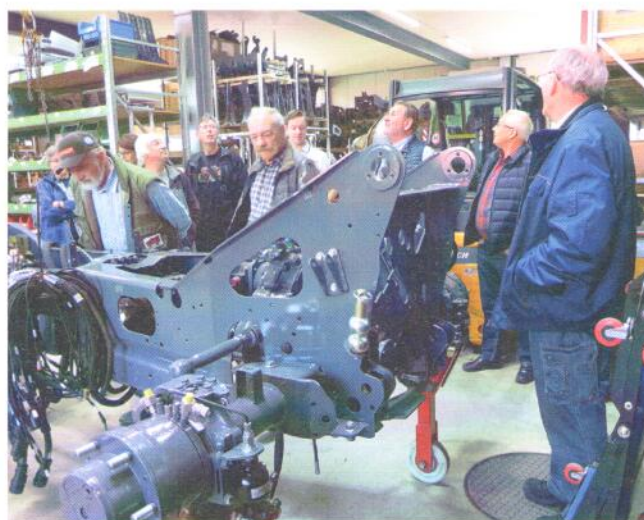
Porschehosi mit Blick ins Innerste.