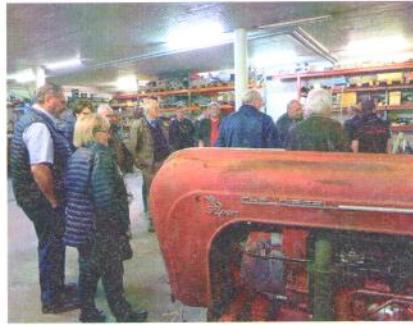
Der Super wartet auf die Restauration.