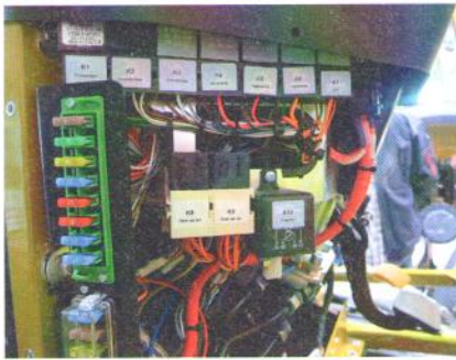
Ohne Elektrik und Elektronik geht nichts.