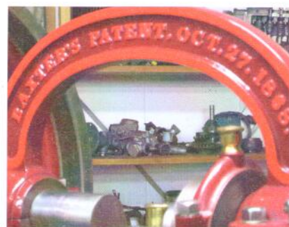
Vor 150 Jahren.