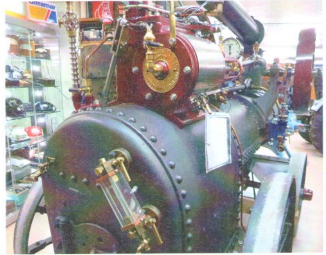
Das Lokomobil für die Landwirtschaft.